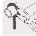
Longitud de cadena: 50 cm